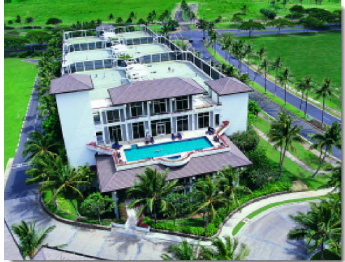
Ihilani Resort and Spa, Hawaii

저희 클라이언트는 호텔 / 리조트와, 아침 온천, 건강과 피트니스 센터, 작지만 모든것들 중에서 가장 중요하고 전반적으로 삶의 변화를 주는 독점적인 데스티네이션 온천, 치료 등 맞춤형 일일 일정, 활동, 건강한 카운셀링을 위한 3일 식사를 포함하고 있습니다. 후자와 같은 클라이언트 포함.